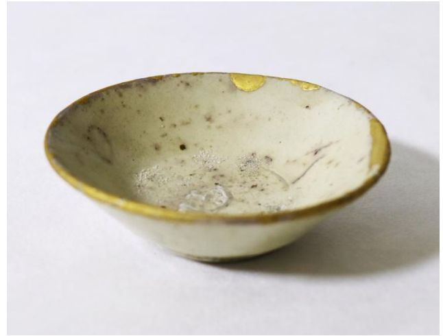
원) 분청 덩빙사발_Ceramics, Lacquer_17.8x17.8x7.7cm_2018