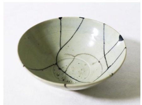
왼) 청화백자잔_Ceramics, Lacquer and Silver_6x6x4cm_2018